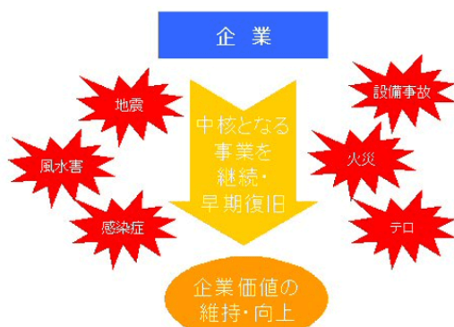
図 (事業継続計画)の役割

緊急時に倒産や事業縮小を余儀なくされないためには、平常時からBCPを周到に準備しておき、緊急時に事業の継続・早期復旧を図ることが重要となります。こうした企業は、顧客の信用を維持し、市場関係者から高い評価を受けることとなり、企業価値の維持・向上につながるのです。